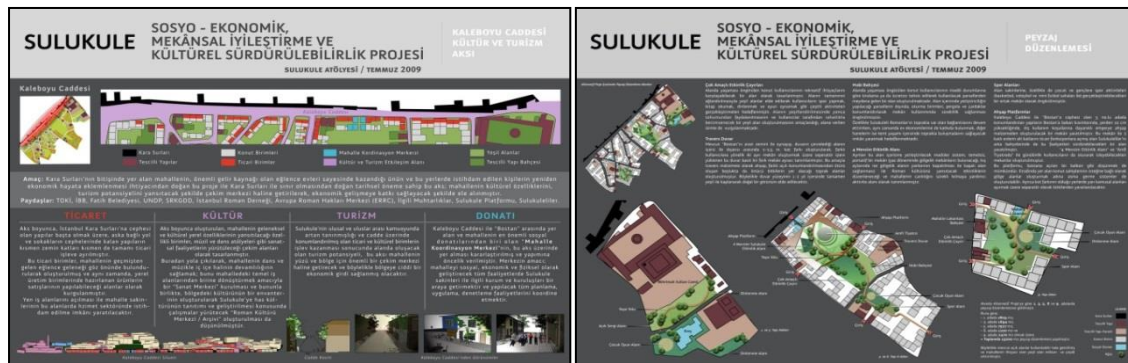
Şekil 6. Sulukule Toplumsal Gelişme-Ekonomik Kalkınma Planı, (Sulukule Atölyesi, 2009)

Gözlem: Uygulanan kentsel dönüşüm projesi ile gözleme olanak tanıyan, temel birim mekan olan, sokak ve yapı dokusu yıkılarak yok edilmiştir. Alternatif proje ise, yalnızca mekansal kararlarıyla değil önerdiği