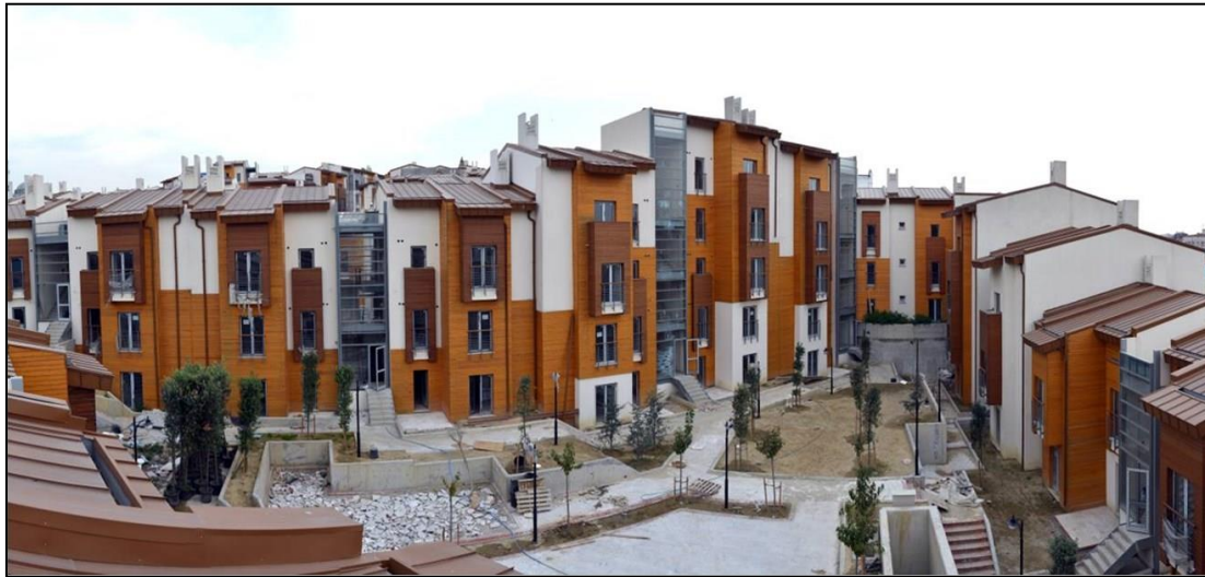
Şekil 4. Sulukule Kentsel Dönüşüm Projesi mevcut durum, (Fatih Belediyesi, n.d.)

Sulukule Kentsel Dönüşüm Projesi, ortaya konulan hedefleri gerçekleştiremeyecek nitelikte olduğu gerekçesiyle eleştirilmiş, alternatif bir plan hazırlanmıştır. Tarafların katılımı ile çeşitli toplantılar gerçekleştirilmiş olsa da, bir uzlaşmaya varılamamış ve sonuçta hazırlanan dönüşüm projesi tüm eleştirilere rağmen uygulanmıştır. Uygulama sonucunda, alanda yaşayan Sulukuleliler alanı terk ederek alanın yakınındaki Karagümrük'e yerleşmiştir. Alanı terk eden halkın yerinde ise, halihazırda “ranzalı yatakhanelere” dönüştürülmüş olan lüks konutlarda, Suriyeli mülteciler yaşamaktadır. Ortalama 20 kişinin yaşadığı konutlardan 300 TL yatak kirası alınarak, aylık 5000-7000 TL kira geliri elde edilmektedir (Anonim, 2016). Bu da, dönüşüm projesini eleştiren ve alternatif plan hazırlayan grubun eleştirilerinin doğruluğunu göstermesi bakımından önemlidir.