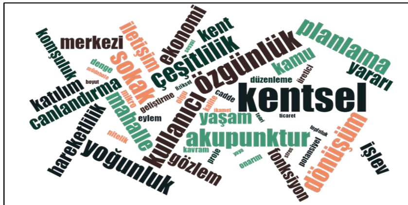
Şekil 1. Çalışma kapsamında oluşturulan kavram listesi 2

Bu makale kapsamında ise; Çeşitlilik (İnsan-İşlev), Sokak, İletişim, Kültürel Miras, Köşe Noktaları, Gözlem, Özgünlük, Yoğunluk, Komşuluk, Mahalle, Katılım, Yerel Ekonomi, Kamu Yararı, İnsan Ölçeği temel kavramlar olarak belirlenmiştir. Bunlara ek olarak, Jacobs’un fikirlerinden ilham alınarak sürdürülen programlardan biri olan, Jane Jacobs’un kurucuları arasında bulunduğu Yaşayan Şehirler Merkezi (Center for the Living City)’nin desteklediği Kentsel Akupunktur çalışmaları da kavram listesine eklenmiştir (Şekil 1).