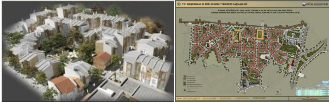
Şekil 3. Sulukule Kentsel Dönüşüm Projesi Mimari Avan Projesi (Kaban, 2011)