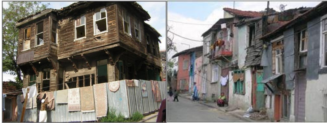
Şekil 2. Sulukule Kentsel Dönüşüm Projesi öncesi (Fatih Belediyesi, n.d.)

Sulukule, bir Roman yerleşimi olarak sosyo-ekonomik yapısı ve tarihi ile İstanbul'un diğer mahallelerinden farklılık göstermektedir. Kentsel Dönüşüm Projesi öncesi, tipik olarak güçlü bir sokak-konut ilişkisi görülmekte, yaşam güçlü sosyal bağlar ile sürmekteydi. Halk gelirini; müzikten, sepetçilik, çiçekçilik ve at yetiştiriciliğinden sağlamaktaydı. 1930'larda ise birçok roman geçimini mahalledeki eğlence evlerinde düzenledikleri gösterilerden sağlamaktaydı. (Kaban, 2011). Yarısı tarihi alan koruma sınırında olan alan, kentsel dönüşüm projesi öncesi çoğunluğu tek katlı olmak üzere en fazla üç katlı konutlardan oluşmaktaydı (Şekil 2).