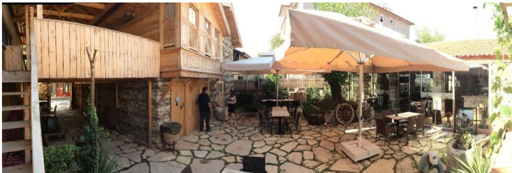
Resim 7. İbradı İlçesi- Ormana Beldesi’nde “dağınık otel” konseptine uygun olarak geliştirilen tesisin resepsiyon, konaklama mekanları ve restoranlarını etrafında toplanan avludan görünüm.

Yapıların restore edilmesi, yeniden işlevlendirilmesi ve performans süreçlerinde yöredeki ustalar ve halk istihdam edilmekte ve kırsal kalkınmaya katkıda bulunmaktadır. Bu faaliyet atalardan miras kalan geleneksel mimarlık ve el sanatlarının da devamlılığını sağlamaktadır. Kültürel mirası koruma amacı taşıyan yatırımcılar ilk etapta ekonomik beklentilerden çok memleketlerine duygusal bağlılık ile hareket etmekte olduğundan yatırımın ilk evrelerindeki ekonomik yüklerle tahammül etme motivasyonuna sahiptir. Bu durum gelecek için umut vericidir. Kıyı tesislerinde konaklayan turistlerin minibüs ile Manavgat – Oymapınar – Ürünlü yolu üzerinden taşınarak Ormana’ya gelme imkanı vardır. Ormana’daki tesisin gelişmesiyle konaklamalı misafirler ile bir ve iki haftalık programlar planlanmaktadır. Bu kapsamda yörenin daha detaylı ve çok yönlü olarak tanıtılması ve ekonomik katkının daha yaygın ve verimli hale getirilmesi mümkün olabilecektir.