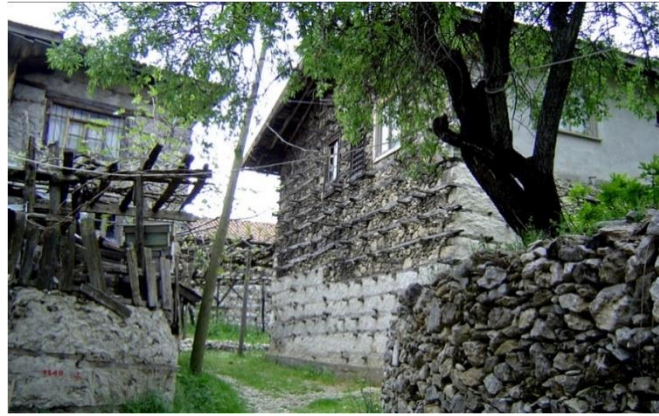
Resim 6. İbradı İlçesi'ndeki bir kırsal yerleşimde karakteristik duvar örgüsü ve geleneksel yerleşim dokusu.

İbradı ilçe merkezinin yaklaşık 4 km. güneybatısında bulunan Ormana geleneksel kırsal yerleşim dokusu ve özgün mimari değerler açısından çok zengin bir yerleşim merkezidir (Çelik 2009 ; Çelik Başok 2017). Yerleşim dokusu, sokaklar, mimari elemanların çeperleri, üzeri asma yapraklarıyla kaplı ahşap çerçeve sistemleriyle örtülü sokak geçitleri yörenin iklimsel, topoğrafik ve ekonomik bağlamına uyumlu olarak biçimlenmiştir. Geleneksel konutlarda iç – dış mekânlar arasında geçişi sağlayan ve evin ortak mekânı olan sofanın dış uzantısı haline gelen ahşap ayazlık yapıları karakteristik bir çevre estetiği üretmiştir (Kavas 2015). Zaman içerisinde geleneksel dokuyla uyumsuz şekilde oluşan müdahalelere rağmen yerleşimde korunarak geleceğe aktarılmaya uygun durumda birçok kültürel miras örneği bulunmaktadır. Yörenin kültürel miras değeri son yıllarda keşfedilmiş bölgeyi tanıtıcı birçok akademik çalışma yapılmıştır (Başarı 2001; Çelik 2009; Kavas 2011; Kavas 2015; Çelik Başok 2017). Bu kültürel mirasın