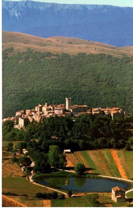
Resim 2. Santo Stefano di Sessanio Köyü'nden genel görünüm: topoğrafik ilişkiler La Guida di bell'Abruzzo (Amadeo Pancella eds.), Edizioni Bell'Abruzzo, San Vito Chietino, Italya, 2006.

düzenlemek ve görsel olarak kontrol altına almak üzere inşa edilmiştir ( Resim 2 ) (Continenza 1996: 11-13).