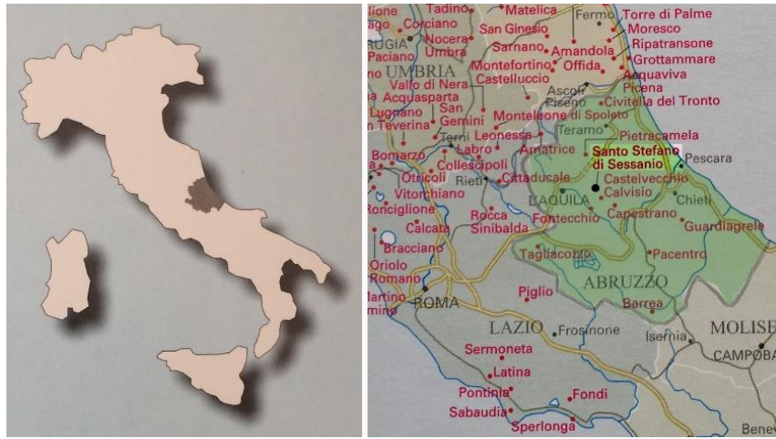
Resim 1. Abruzzo İli'nin İtalya'daki konumu (solda) ve Santo Stefano di Sessanio köyünün Abruzzo İli, L'Aquila İlçesindeki konumu

Abruzzo İli Orta İtalya'da, başkent Roma'nın bulunduğu Lazio İli'nin doğu sınırından Adriyatik Denizi'ne kadar uzanan ve L'Aquila, Teramo, Pescara ve Chieti İlçelerini kapsayan bir idari bölgedir ( Resim 1 ). L'Aquila İlçesi Abruzzo İli içerisinde denize kıyısı olmayan tek idari birim olarak daha çok Gran Sasso ve Maijella adlı Sıradağlar, küçük göller, ormanlar, ovalar ve yaylalardan oluşan engebeli, dağlık bir arazi yapısına sahiptir (Totani 2008: 31). L'Aquila sınırları içerisinde özellikle Ortaçağ'da inşa edilmiş surlarla çevrili, topoğrafya ile bütünleşik birçok kırsal yerleşim merkezi bulunur ( Resim 2 ). Bu kırsal yerleşimler hayvancılık temelli geleneksel bir ekonomik modelin oluşturduğu çevresel bir sistem ile birbirine bağlanır (Kavas 2011: 25). Böylece bölgenin tarihinde farklı yerleşimler belirli bir ekonomik model ve çevresel bağlam içerisinde tutarlı bir sistem (Rapoport 1990: 12-13) oluşturmuştur.