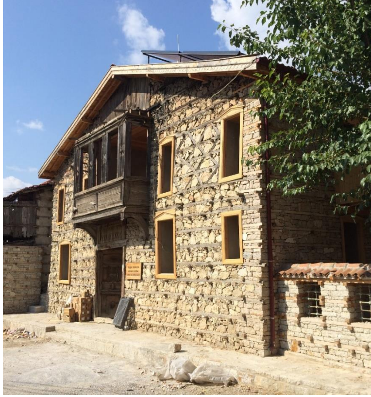
Resim 8. Ormana Beldesi'nde "dağınık otel" modeline uygun olarak geliştirilen tesisin konaklama mekânlarını içermek üzere yeniden düzenlenen bir geleneksel konut (Eylül 2014).