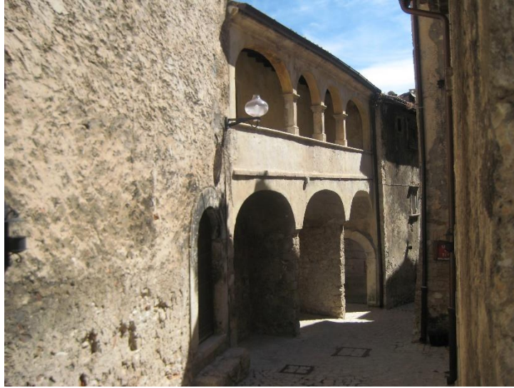
Resim 4. "Köy-otel" modeli bağlamında Santo Stefona di Sessanio yerleşiminden bir sokak görüntüsü

S. Stefano'nun kırsal turizm bağlamında değerlendirilmesi 1999 yılına dayanır. Daniel Kihlgren adlı yatırımcı tarafından 1999'da keşfedilen köy bakımsız bir durumdayken adı geçenin geliştirdiği "dağmık otel" konseptiyle birçok ev orijinal durumuna uygun biçimde restore edilerek yeni işlevler yüklenmiştir (Kihlgren 2014). Yatırımcı yerleşim merkezinin Roma dönemindeki ismi olan "Sextantio" kelimesini işletmesine isim olarak seçmiştir. Bu kırsal turizm tesisi 2005 yılında faaliyete geçmiştir. Yerel halka istihdam sağlayan tesis ortaçağdan kalma 6 adet tarihi yapıya dağılmış 27 otel odası, resepsiyon ve iki restoran ile hizmet vermektedir (Kihlgren 2014). İlk görünüşte Abruzzo'da unutulmuş kırsal köylerden biri izlenimini uyandıran S.Stefano aslında alternatif turizm arayışı içerisindeki gezginler için konaklama imkânı sunan bir "köy-otel" haline gelmiştir ( Resim 4 ). Tesis 2005'den itibaren otel orijinal konsepti ve kültürel mirasın korunmasına yaptığı katkı ile ödüller almış, ünlü isimleri ağırlamış ve film çekimlerinde kullanılmıştır (Fritz 2010). Bu gelişmeler Santo Stefano di Sessanio'nun tanıtımına büyük katkı sağlamıştır.