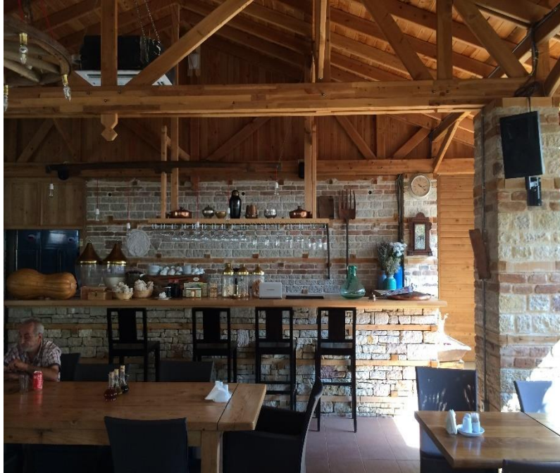
Resim 9. Ormana'da "dağınık otel" model uygun olarak tasarlanan tesisin restoran bölümünden iç mekân görünümü.