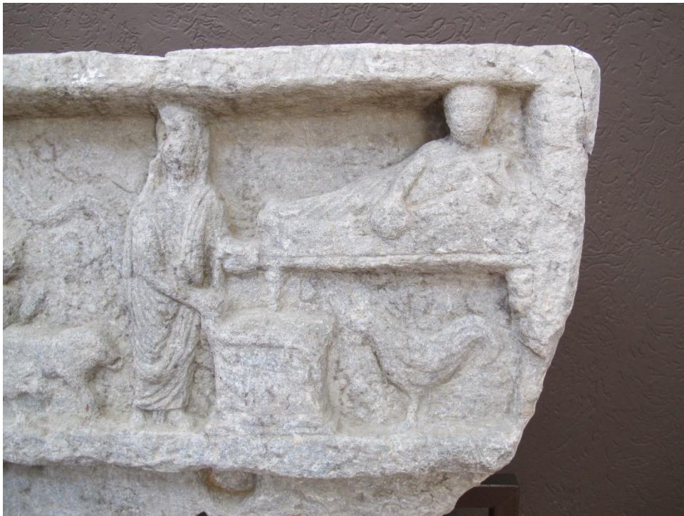
RESİM 8 Kabartmada kline üzerine uzanmış nehir tanrısı Skamandros