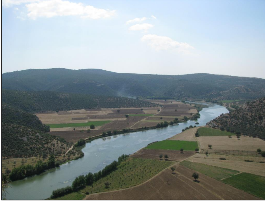
RESİM 1: Troia yakınlarında, Araplar Boğazı içinden akan Skamandros ırmağı

yerleşim bulunmaktadır. (RESİM 2) Çanakkale Boğazından, İda Dağına kadar geniş bir coğrafyayı birbirine bağlayan bu akarsu bölgenin ekonomik ve sosyokültürel hayatında önemli bir rol oynamaktadır. Tarih boyunca Skamandros ırmağı kıyısını takip eden yollar iç Troas ile kıyı arasında ticaret ve iletişimi sağladığı gibi, İda dağından kesilen keresteler nehir boyunca yüzdürülerek taşınmıştır (Körpe 2017; Korfmann 2004; Körpe ve Yavuz 2007).