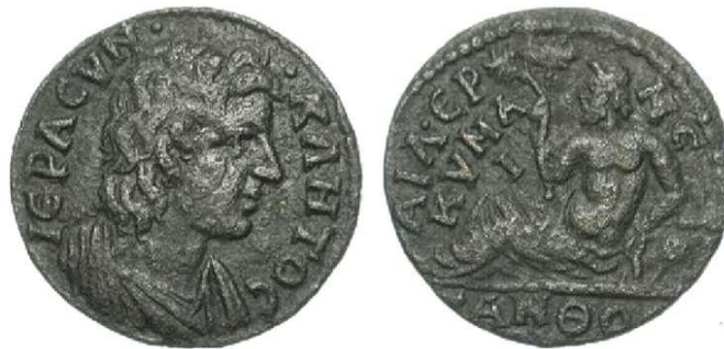
RESİM 10 Kyme sikkesi üzerinde nehir tanrısı Skamandros