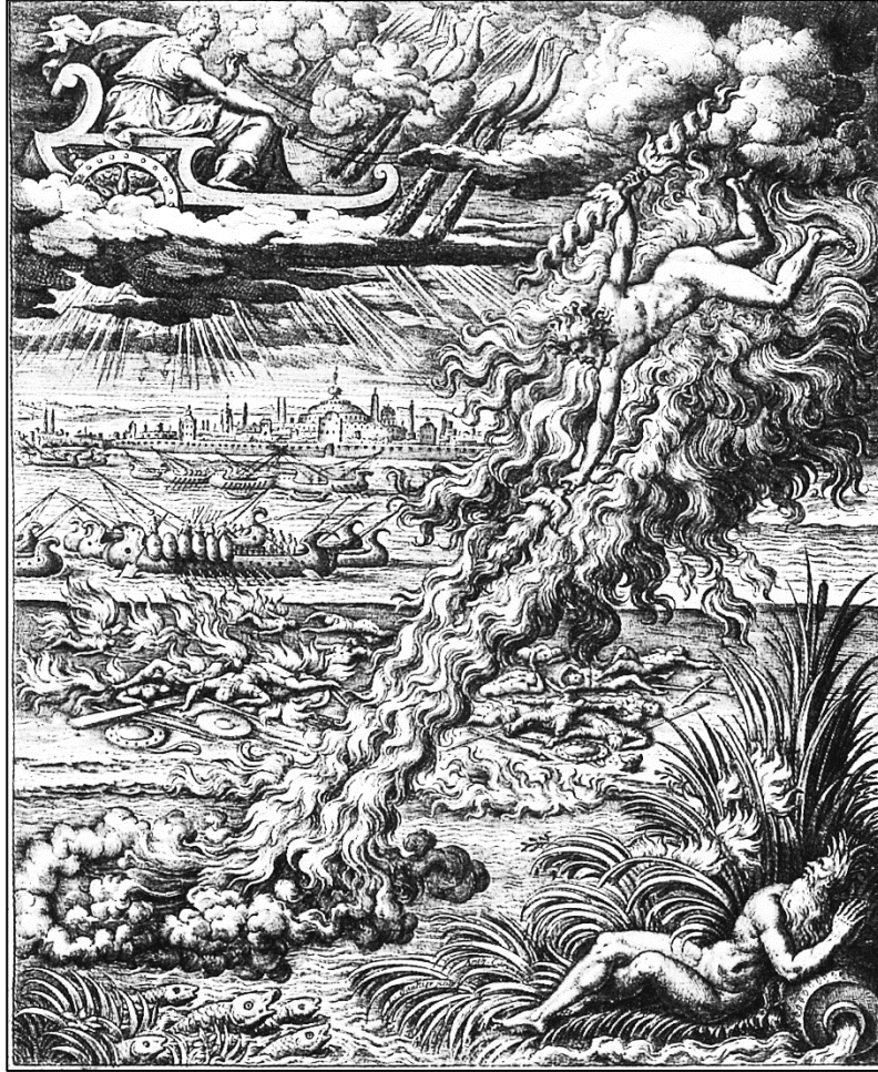
RESİM 3: Philostratus'un 1614 yılında yayınlanan kitabı içindeki gravür (Scamander' tableau)