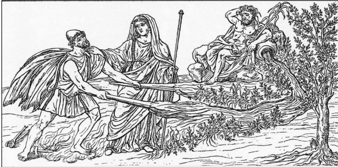
RESİM 6 IliasAmbrosiana 'dakiFigure 4.3, miniature L III

Üzerinde nehir tanrısı Skamandros'un tasvirinin bulunduğu yazıt ve kabartma 1966 yılında Karamenderes'in Akçin çayı ile birleştiği yerde bulunmuştur. Çanakkale Arkeoloji müzesinde 2330 envanter numarası ile kayıtlı bulunan ve M.S. 2. yüzyıla tarihlenen bu kabartma, bir