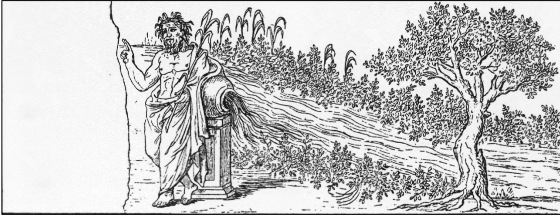
RESİM 5 IliasAmbrosiana 'dakiFigure4.2, miniature L II