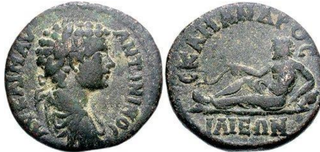
RESİM 9 İlion sikkesi üzerinde nehir tanrısı Skamandros

Skamandros heykel ve kabartmalar dışında Roma çağında başta Troia olmak üzere Skepsis ve Kyme sikkeleri üzerinde de karşımıza çıkar (Mionnet 1808; Imhoof-Blumer 1924; Bellinger 1961; Tekin, Altınoluk ve Körpe 2009). (RESİM 9) (RESİM 10) Kabartmalarda pek çok nehir tanrısı gibi orta yaşlı sakallı bir erkek olarak tasvir edilen Skamandros, aynı şekilde Roma İmparatorluk dönemi sikkeleri üzerinde de daima sırtını bir yere dayanarak uzanır vaziyette betimlenmiştir (Altınoluk 2005). Kolunun altında içinden ırmağın kaynağının çıktığı yatay vaziyette bir amphora veya benzeri bir kap bulunur. Skamandros’u diğer nehir tanrılarından ayıran özelliği ise elinde tuttuğu bitki sapıdır. Hem Kyme sikkelerinde, hem de İlion sikkesinde tanrı elinde uzun saplı bir dal tutmaktadır. İlion sikkesinde belli olmasa da, Kyme sikkelerinde bu sapın ucunda geniş yapraklar bulunur. Skamandros ırmağında yetişen bir tür su bitkisi olduğu düşünülen bu bitkilerin günümüzde halen Karamenderes kıyılarında yetişmektedir.