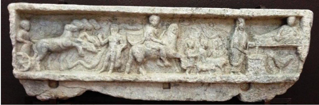
RESİM 7 Ezine yakınlarında Karamandres içinde bulunan kabartma

Dikdörtgen şeklindeki stelin üzerinde soldan sağa doğru: Bir quadriga ve süvarisi ile onu ayakta karşılayan ayakta çıplak bir figür, ortada at üzerinde binicisi ve en sağda kline üzerinde uzanmış bir figürün önündeki sunağa libasyon yapan bir kişi yer alır. Kline üzerindeki figür başını sahnenin üzerindeki bordüre yapışmış ve sağ tarafa yaslanmıştır. Kısa saçlı ve sakalsız olan figür karşıya doğru bakmaktadır. Üzerinde vücudunun üst kısmını açıkta bırakan bir himation vardır. Sol kolu üzerine yaslanmış, sağ elinde ise yuvarlak bir nesne tutmaktadır. (RESİM 8) Altta bulunan yazıttan kline üzerine uzanan bu kişinin nehir tanrısı Skamandros olduğu anlaşılmaktadır. Sahne aslında bu tanrıya yapılan sunuyu tasvir etmektedir. Zafer Taşlıklioğlu, yazıtı okumuş ve tercüme etmiştir (Taşlıklioğlu 1971).