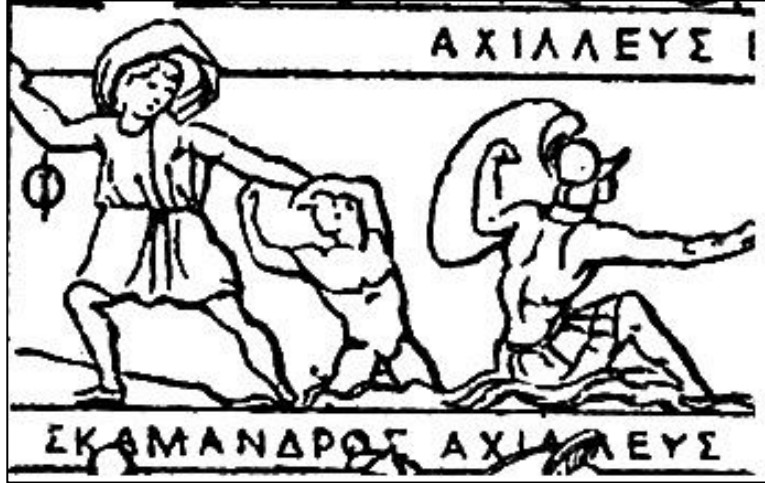
RESİM 4: TabulaeIliacae üzerindeki firizlerde de Skamandros'un Akhilleus'u kovaladığı sahne detayı.

Hektor'un gözbebeği o, ışıldayan yıldız benziyordu, HektorSkamandros'lu derdi ona, başkalarıAstynax, şehrin kralı, derdi, İlyon'u tek başına koruyan Hektor'du da ondan. (Homeros, İl. VI, 400)