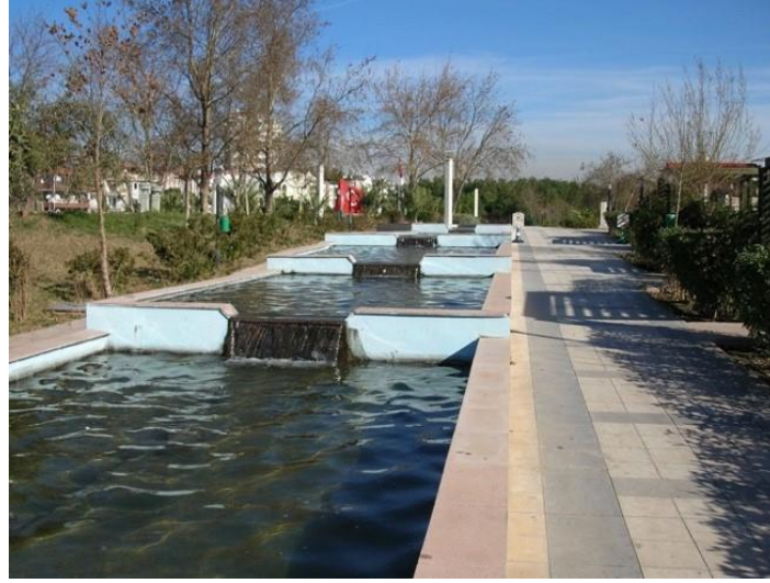
Şekil 14. Konyaaltı Kent Meydanı ve Kotlu Havuz Tasarımı