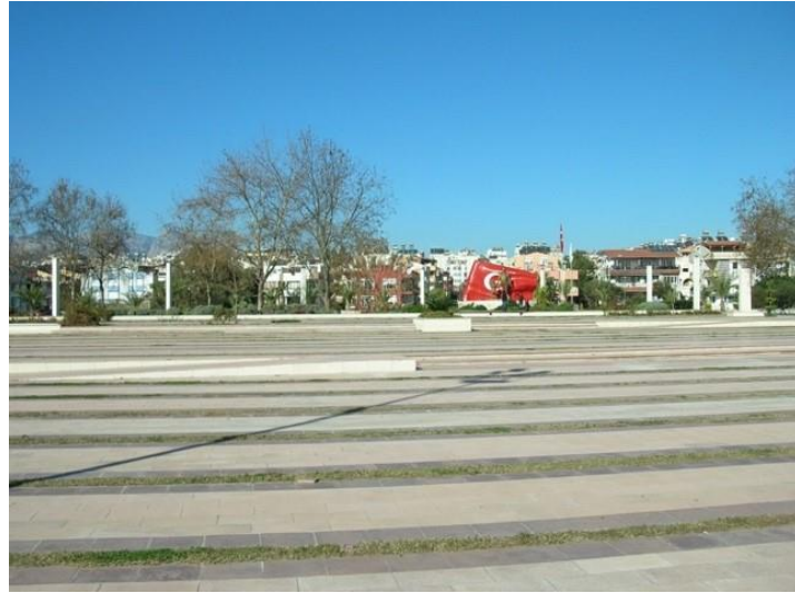
Şekil 13. Konyaaltı Kent Meydanı ve Atatürk Bustü

Konyaaltı Kent Meydanı, yarışmayı kazanan müellifler tarafından şu şekilde aktarılmıştır : Akdeniz'den referans olarak oluşan meydan, meydanı biçimleyen ve yaşatan, yaşama sevincini kamçıl原因an yaşam ve sanat aksları, aynı mimari dille meydana çıkan rekreatif faaliyetlerin çeşitliliğini zenginleştiren aktivite aksı tasarımının temel unsurlarıdır. Kapalı alan olarak sadece 0.0088 emsal ile max. h: 5.50 yüksekliğinde 600 metrekare olarak tasarlanan projede 3 büfe, 3 kafe, satış birimi, çok amaçlı yapı ve restoran bulunmaktadır. Meydanın kuzeyinde 80 araçlık, batısında ise 25 araçlık açık otopark ve çocuk oyun alanı düzenlenmesi yapılmıştır. (Esengil 2010)