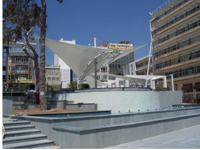
Şekil 8. Cumhuriyet Meydanı Gölgeleme Alanı

Cumhuriyet Meydanı, kent için ilk meydan olması özelliğinin yanısıra, her zaman simgesel özelliğini korumuştur. Kent ölçeğinde incelendiğinde ‘yer’ olan meydan, birey ölçeğinde de kentte yaşayan insanlara aidiyet hissi vermesi, estetik değeri olan çevresel donatılarla desteklenmesi ve kentliler için anlam taşıması bakımından da bir “yer” olarak değerlendirilebilir.