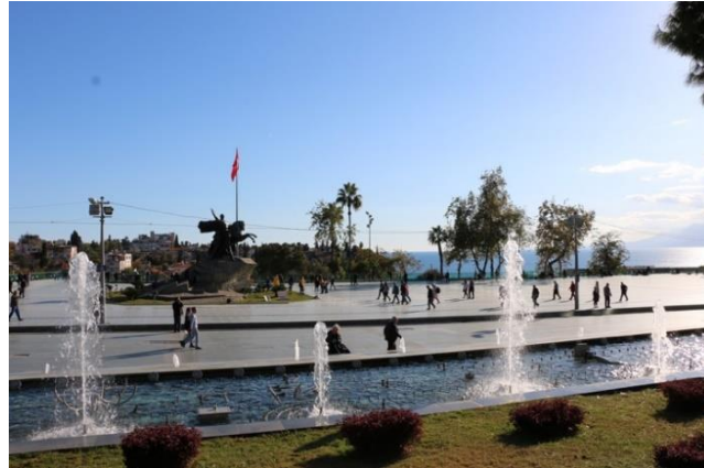
Şekil 7. Cumhuriyet Meydanı Havuz Alanı

Hükümet binasının 2008’de yıkılmasından sonra yapılan ve günümüze ulaşan düzenlemede meydana su elemanları (Şekil 7), oturma birimleri, yeşil alanlar, gölgeleme elemanları, seyir terasları gibi birimler bulunmakta, meydanın kuzey kısmının altında ise 2 katlı 14 araçlık büyük otobüs, 5 araçlık küçük otobüs ve 76 araçlık otomobil otoparkı bulunmaktadır. Meydan; çiçeklikler, banklar, alçak ve yüksek boylu aydınlatma direkleri, çöpler, sigaralıklar, döküm ağaç koruyucular ve membran gölgeleme alanları (Şekil 8) gibi estetik değeri olan donatılarla desteklenmektedir.