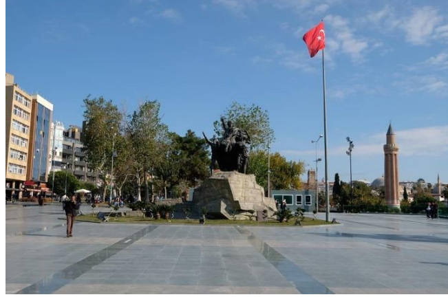
Şekil 5. Ulusal Yükseliş Anıtı