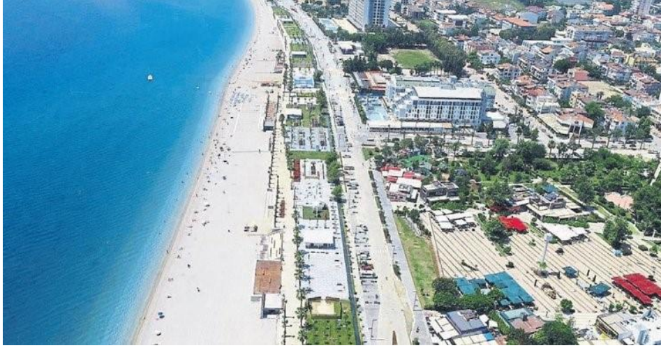
Şekil 12. Konyaaltı Kent Meydanı ( https://www.sabah.com.tr/akdeniz/2018/05/18/antalyanin-gerdanligi )

Konyaaltı Kent Meydanı, yarışmayı kazanan müellifler tarafından şu şekilde aktarılmıştır : Akdeniz'den referans olarak oluşan meydan, meydanı biçimleyen ve yaşatan, yaşama sevincini kamçıl原因an yaşam ve sanat aksları, aynı mimari dille meydana çıkan rekreatif faaliyetlerin çeşitliliğini zenginleştiren aktivite aksı tasarımının temel unsurlarıdır. Kapalı alan olarak sadece 0.0088 emsal ile max. h: 5.50 yüksekliğinde 600 metrekare olarak tasarlanan projede 3 büfe, 3 kafe, satış birimi, çok amaçlı yapı ve restoran bulunmaktadır. Meydanın kuzeyinde 80 araçlık, batısında ise 25 araçlık açık otopark ve çocuk oyun alanı düzenlenmesi yapılmıştır. (Esengil 2010)