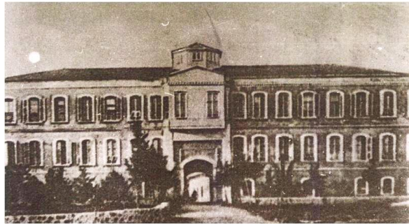
Şekil 3. Eski Hükümet Konağı (1920) (Aykurt,2010)

Antalya kent merkezinin ilk meydanı olma özelliği taşıyan ve 11.500 metrekarelik alana sahip olan Cumhuriyet Meydanı, Kaleiçi surlarının hemen dışında konumlanır. Önceleri Mutassarıklık, sonraları Antalya Hükümet Konağı'nın (Şekil 3) burada yer alması, Antalya'da bütün resmi etkinliklerin bu cadde üzerindeki meydana yapılmasına neden olmuş, dolayısıyla adı da Cumhuriyet Meydanı olarak değişmiştir (Aykurt, 2010: 38).