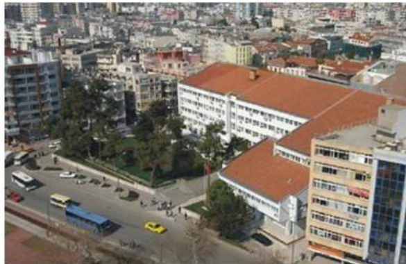
Şekil 4. 2008 senesinde yıkılan Hükümet Binası (Aykurt,2010)

Cumhuriyet Meydanı, Avrupa'daki meydan örnekleri ile bu bakımdan meydanın etrafındaki yönetim birimleri ile şekillenmesi benzer özellik taşır. Ancak meydanın şekillenmesine katkısı olan bu yapı (Şekil 3) maalesef günümüze ulaşmamıştır. Meydana kimliğini kazandıran, önemli bir sanatsal öge olan 'Ulusal Yükseliş Anıtı' ise 1965 yılında yarışma projesi sonucu elde edilerek, meydana kazandırılmıştır (Aykurt 2010).