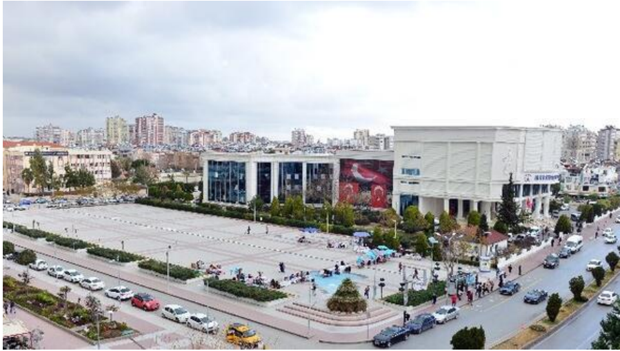
Şekil 15. Muratpaşa Kent Meydanı

Kentin en eski yerleşim yeri olması nedeniyle Muratpaşa'nın tarihi aynı zamanda Antalya'nın da tarihidir. Tarihi Kaleiçi Bölgesi'ni içerisinde barındıran sınırları, zamanla doğuya doğru genişleyerek günümüzdeki sınırlarına ulaşmıştır. Son yıllarda aldığı göç ile tıpkı diğer belediye sınırları gibi hızla genişlemiş ve günümüzde 8 bin 804 hektarlık alana sahiptir. 20 kilometre sahil kıyı bandı bulunan Muratpaşa'nın güneyinde Akdeniz, kuzeyinde Kepez ilçesi, batısında Konyaaltı, doğusunda da Aksu yer almaktadır. 1993 yılında Büyükşehir Belediyesi'nden ayrılan belediye, daha sonra kent merkezinin yaklaşık 7 km doğusundaki Lara bölgesinde yeni belediye hizmet binası inşaatının tamamlanmasıyla buraya taşınmıştır.