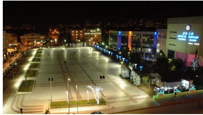
Şekil 17. Muratpaşa Kent Meydanı Gece Görüntüsü

Söz konusu açık alanın doğu ve batı çeperleri insan ölçeğine yabancı, yarı-açık ve açık mekan kullanımları ile meydanı beslemeyen iki yapı ile tarif edilmiştir. Doğu kısmında belediye hizmet binası, batı kısmında AVM bulunmaktadır. Tarihsel gelişimi itibarı ile “yok-yer” niteliğindeki bir yapı tipinin temsilcisi olan AVM bloğunun konumlandırılması meydan kavramının ilk hedefi olan ‘yer’ niteliğinden uzaklaşarak, ‘yok-yer’e evrilmesini desteklemiştir. AVM halihazırda oldukça dışa kapalı, bireyin anonimleştiği, aidiyet duygusunu kaybettiği ve kendi içinde yok-yer olma özelliğini barındıran bir yapıdır. Dolayısıyla Muratpaşa Kent Meydanı, doğudan ve batıdan beslenmeyen çeperlerle çevrelenmiştir. Kent ölçeğinde değerlendirildiğinde, kentli aidiyeti açısından herhangi bir katkısı olmayan mekân, birey ölçeğinde ise belediyeye veya alışveriş merkezine ulaşımı sağlayan bir yaya dolaşım aksı, bir sert zemin olarak kullanılmaktadır. Kent hafızaya katkı sağlayamaması, deneyimleyen bireylerde ayırt edici bir anı bırakmaması ve dolayısıyla aidiyet hissini üretilememesi bakımından bu meydan denemesi hem kent ölçeğinde, hem birey ölçeğinde “yer” üretimini geliştirme potansiyeline sahip değildir. Dolayısıyla bu örneğin ‘yok-yer’ niteliğine daha yakın olduğu değerlendirilebilir.