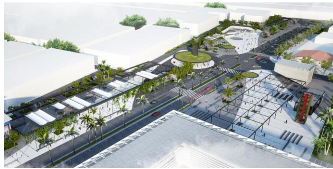
Şekil 9. Kepez Kent Meydanı ( https://www.kepez-bld.gov.tr/news.php?id=6202/Kepezin-kalbine-%E2%80%98Kent-Meydani )

Yapım çalışmaları hala devam etmekte olan Kepez Kent Meydanı Projesi, kültürel, sanatsal, sosyal, sportif ve ticari faaliyetlerin yanı sıra peyzaj alanlarını da içinde barındırmayı hedeflemektedir. Kepez Kent Meydanı Projesi birinci kısım 54 bin metrekarelik, ikinci kısım tamamlanınca 166 bin metrekarelik bir alanı kapsamaktadır. Kepez’in coğrafi olarak merkezi olan Seyhan Caddesi’nde inşa edilen Kepez Kent Meydanı’nda çok amaçlı etkinlik alanı, rekreasyon, spor ve toplanma alanları, tören alanı, anıt alanı, ticari birimler, kamusal alanlar yer almaktadır.