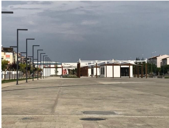
Şekil 11: Kepez Kent Meydanı Asma-Germe Sistemler

Kepez Kent Meydanı, kent ölçeğinde değerlendirildiğinde belediye sınırları içerisinde bir anlam ifade edebilecekken, kent ölçeğinde bir 'yer'e dönüşmesi olası görülmemektedir. Bunun sebepleri arasında kapalılık hissinin zayıflığı, kentten diğer meydanlara nazaran uzak kalması gösterilebilir. Belediye sınırlarının merkezinde bulunması dolayısıyla, kolay ulaşılabilirlikle beraber bireylerin hafızasında ve anılarında da kolayca yer edinmesi beklenmektedir. Bu bağlamda, Kepez sakinlerinin kent meydanına gitmesi, hafızalarında anılar biriktirmesi, birey ölçeğinde kendilerine bir 'yer' edinmeleri olası görülmektedir. Ancak, kent ve birey ölçeğinde olumlu olarak görülen bu planlama için; yapım aşamasında planlı, kaliteli ve olumlu bir inşa süreci oldukça önemli rol oynamaktadır.