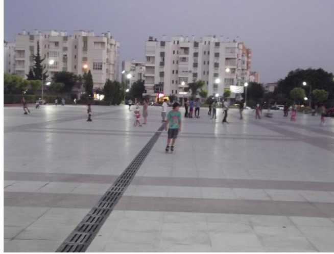
Şekil 16. Muratpaşa Kent Meydanı Sert Zemin Kaplaması