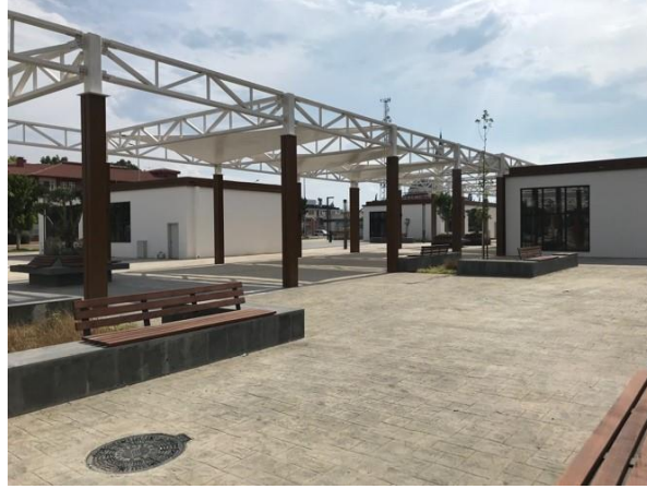
Şekil 10. Kepez Kent Meydanı Gölgeleme Elemanları ve Kalıcı Yapısal Elemanlar