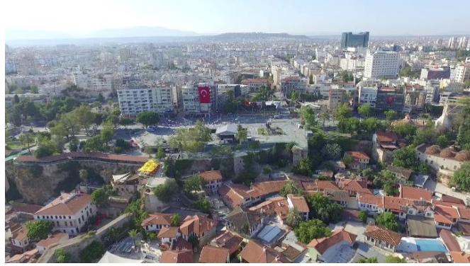
Şekil 6. Cumhuriyet Meydanı Hava Fotoğrafı