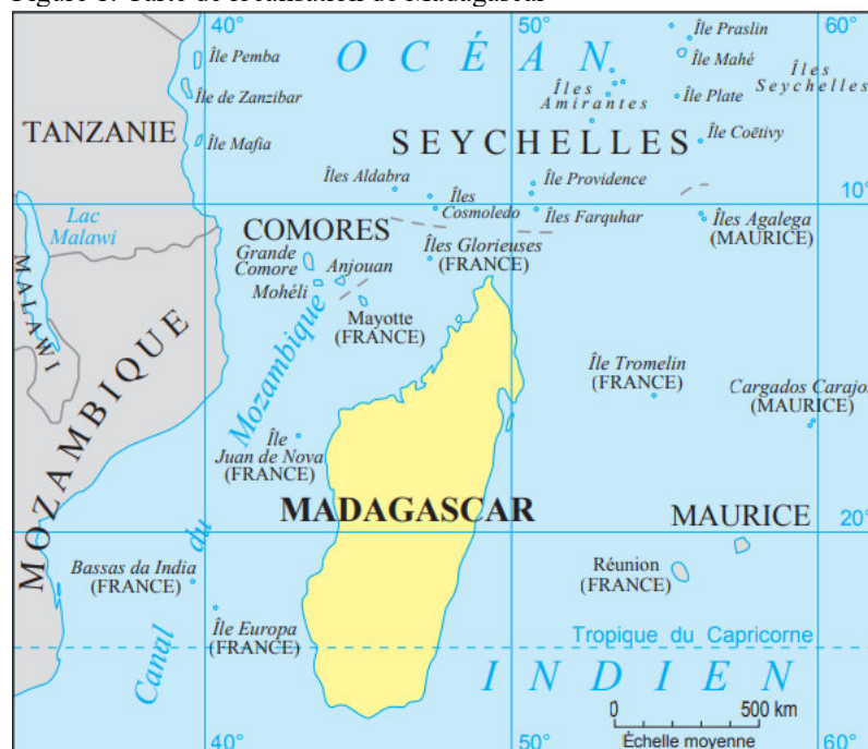
Figure 1. Carte de localisation de Madagascar